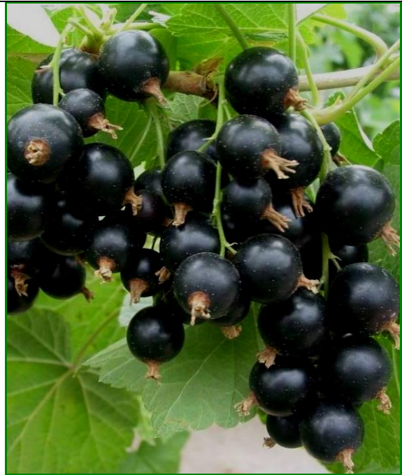
Owoce odmiany Gofert