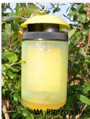
Rys. 8. Polska pułapka.