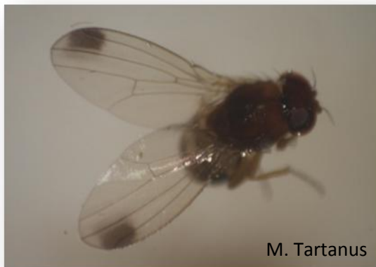
Rys. 4. Samiec – plamki na skrzydłach

cechą jest silne, ząbkowane pokładełko, którym nacinają skórę owocu podczas składania jaj do jego wnętrza.