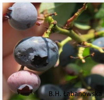
Rys. 2, 3. Owoce borówki uszkodzone przez D. suzukii , plantacja we Włoszech.

W USA stwierdzono straty w zbiorach z powodu uszkodzenia owoców przez muszkę plamoskrzydłą na poziomie 20-40%, (mimo wykonania 5-7 zabiegów chemicznych zwalczających szkodnika), natomiast we Włoszech przy dużym zagrożeniu i braku zwalczania straty plonu sięgały nawet 100%. Z drugiej strony chemiczne zwalczanie D. suzukii przeprowadzane podczas dojrzewania owoców, tuż przed zbiorem, jest niebezpieczne, gdyż mogą być one zdyskwalifikowane, ze względu na pozostałości pestycydów, które mogą przekraczać dopuszczalne poziomy.