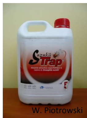
Rys. 11. Hiszpański płyn wabiący.

W sadach czereśniowych i wiśniowych pułapki należy zawieszać na wysokości 1,0-1,5 m nad ziemią, natomiast w przypadku polowej uprawy truskawki bezpośrednio nad ziemią, w taki sposób, by nie były one uszkodzane podczas zabiegów pielęgnacyjnych (np. przez belkę opryskiwacza). W uprawach tunelowych truskawek zawieszają się je w rzędzie na wysokości około 10 cm nad roślinami.