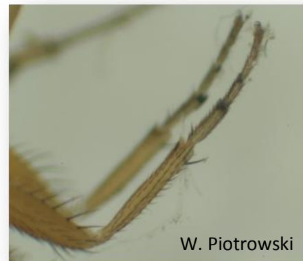
Rys. 5. Samiec – grzebień na odnóżach