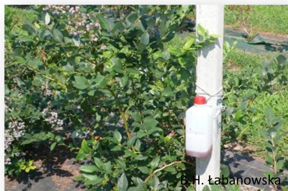
Rys. 7. Pułapka do odłowu D. suzukii wykonana przez sadownika (Włochy).

muchy. Tak przygotowane pułapki zawiesza się na grubszych pędach krzewów lub na specjalnych kołkach bądź na drutach (jeśli tak prowadzona jest uprawa) na plantacji. Pułapki umieszcza się na wysokości owocowania krzewów.