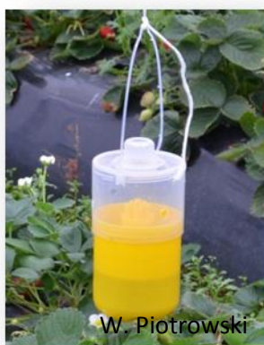
Rys. 10. Hiszpańska pułapka.