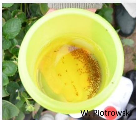
Rys. 9. Polski płyn wabiący.