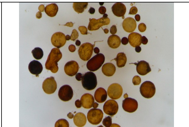
Spory różnych gatunków arbuskularnych grzybów mikoryzowych AMF